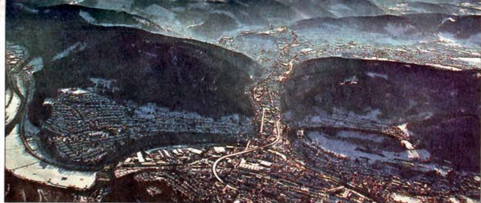
Die Affelnerin Mirja Klicks hielt diesen Blick aus dem Cockpit ihres Segelfliegers mit ihrer Kamera fest – jetzt gehört ihre Aufnahme mit zu den ausgewählten Motiven für den Bildband „Westfalen entdecken“.